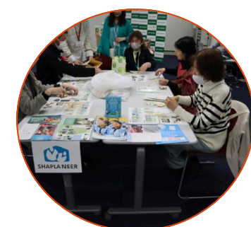
ボランティア体験