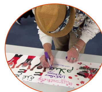
ガザの人々への寄せ書き