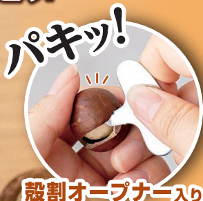
殻割オープンナー入り