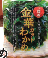
便利な チャックシール付