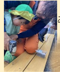
みんなで打ったよ