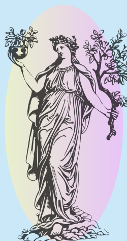
平和の女神エイレーネ