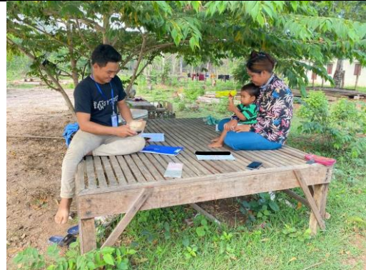
インタビューの様子