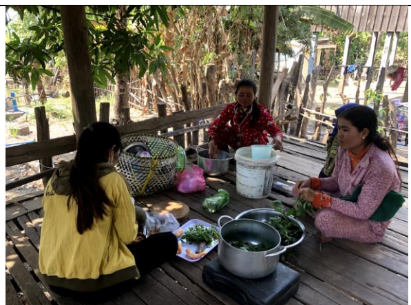
離乳食教室実施に向けての準備