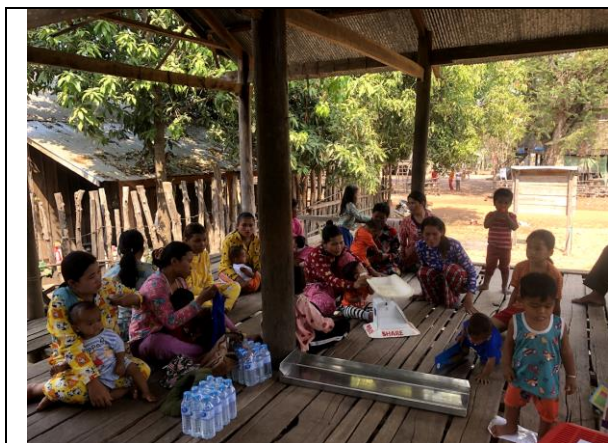
乳幼児健診の実施

ロックダウンが実施されていた 4 月には活動が停止せざるを得ない状態であったが、コロナ禍であっても、参加者の手指消毒や機材の消毒を行い、感染症対策の措置をとりながら、実施をしてきました。2017 年から、シェアがプレアビヒア州で活動を続けていく中で、州保健局も乳幼児健診を定期的実施しながら、子どもの成長を見守っていくことの大切さを理解し、シェアの活動の早期再開につながる事ができた。また、大きな村では、午前と午後の 2 回に分けて、人数制限を行いながら、実施した。コロナによって、村の人々の生活への影響も少なからずあり、今後においても引き続き、妊産婦や子どもたちの健康を見守っていく必要があることを痛感しています。