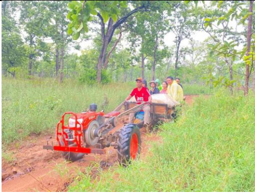
エンドライン調査に向かう様子