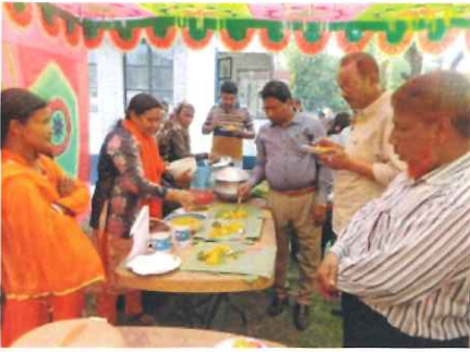
試食する審査員たち。バナナの葉を皿がわりに提供したことも評価のポイントに。何よりも味がよかったそう