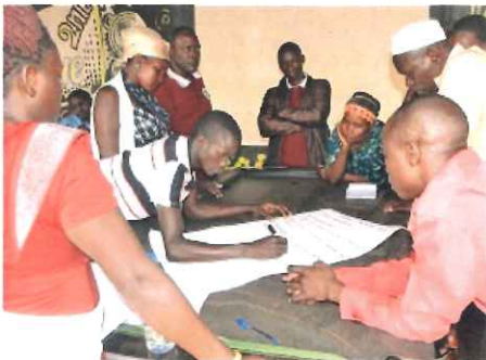
理想と現状のギャップを埋めるために、どのように貧しい世帯の返済能力を審査すべきか積極的に意見を出し合った