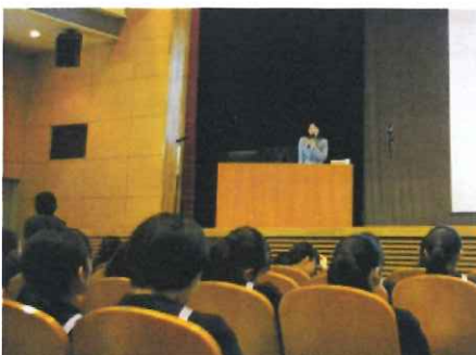
多くの学校で講演を行う(実践女子学園中学校) コロナ禍でもオンラインで啓発を続けている

学校で講演やワークショップを行うとともに、イベント開催や出展、事務所訪問受け入れなどの機会に、世界の飢餓の現状とHFWの活動について伝え、解決のための行動を呼びかけています。HFWが事務局を務める「世界食料デー」月間2019では、さまざまな情報発信やイベントを開催しました。横浜市との共催で開催した若者を対象としたイベントでは、私たちの「食」とSDGsについてともに考える機会を持ちました。