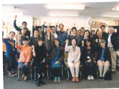
事務所に届く書損じハガキ等の仕分けとカウントには、個人・企業など多くのボランティアが活躍