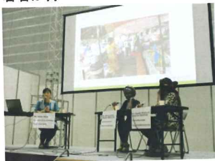
約70名の聴衆の前で、現地の様子を伝えるベナンとブルキナファソのYEH代表

若者が持っている力を存分に発揮し、自ら飢餓を終わらせることができるようにサポートしています。