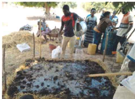
農業省の専門家に依頼し、土壌を改善する有機たい肥の作り方を学ぶ