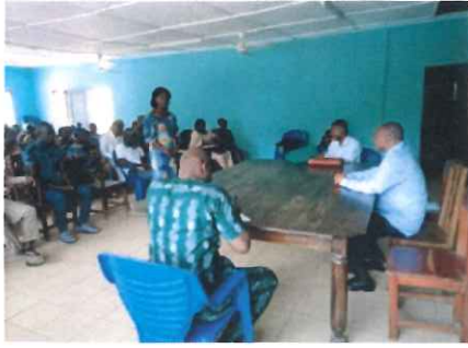
ゼ郡長官に多くの住民の要望であることを伝えようと、78名のメンバーでホールを訪れた代表の3名が、長官(写真右端)に要望を伝えた

政府や国際機関に対し、効果的な政策などを提言し、飢餓を生み出す社会構造を変えていくことをめざしています。