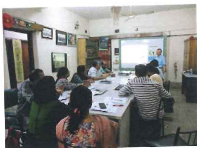
不正流用自体と適正化施策の取り組みへの理解を深めるための職員対象のワークショップ。コロナの影響でオンラインも活用したが、本部と全支部で完了した

日本の本部では、専門技術を備えたボランティアやインターンが活躍しました。イベント運営や「書損じハガキ回収キャンペーン」、広報等にも多くのボランティアが参加し、質の高い活動を推進する力になっています。