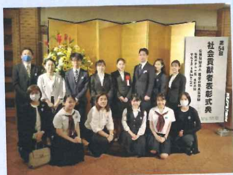
5カ国での活動が認められ、青少年組織のYEHが、(公財)社会貢献支援財団の第54回社会貢献者賞を受賞した(2020年5月24日。表彰式典にて)

※回収キャンペーンの資金は、こうしたYEHによる開発事業や啓発活動の費用に活用させていただきます。その他、青少年の活動をサポートするために必要な調査・評価活動、各種研修や運営費の一部にもあてさせていただきます。