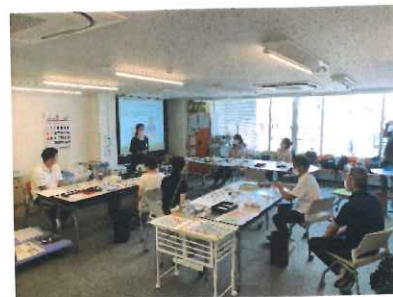
コロナ禍では感染防止対策をして集計作業を進めた。作業の遅れを心配して駆けつけてくださったパルシステム東京の役職員の方々

※回収キャンペーンの資金は、こうした組織力強化のための研修費や会議の開催費など、運営費の一部にもあてさせていただきます。