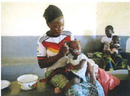
多くの子どもたちが栄養のあるおかゆを食べて回復した