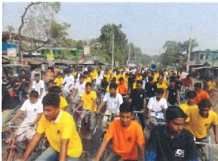
シャツには“ベンガル語で“食料を無駄にせず飢餓のないバングラデシュを実現しよう”のメッセージ。今はSNSキャンペーンに切り替えている

海外の活動国では、誰もが「食料への権利」を持っていることを伝え、実現のために行動することを訴えています。日本でも、飢餓や世界の食料問題について伝える人を増やし、解決のために行動するよう働きかけています。