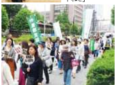
パレードのスローガンは、「つないでつないで東京から平和を」