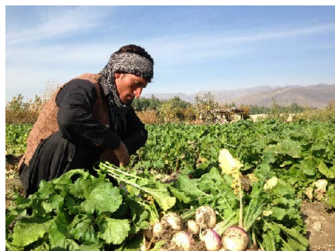
蕪もよくとれた PMS 農園