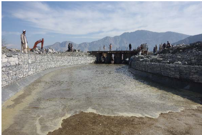
ミラーン通水（2015年2月18日）