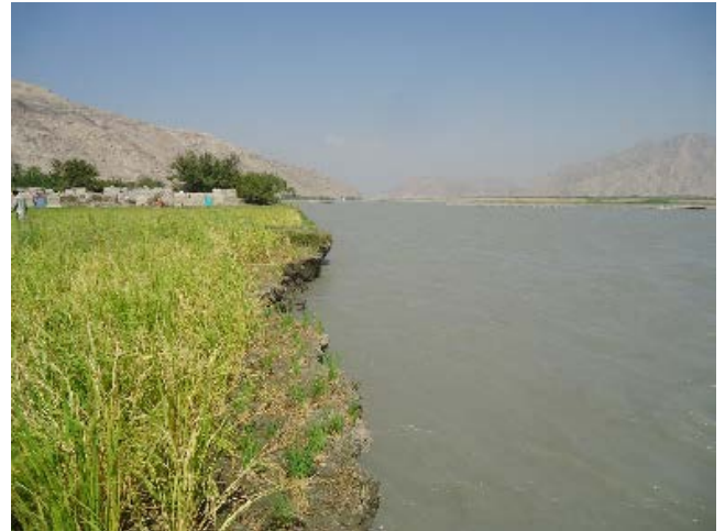
洗掘されるミラーン村落（2014年9月）