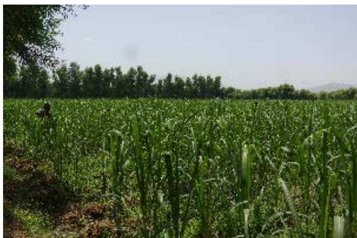
サトウキビ初収穫（2014年）